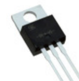
MBR30150CT C0G TSC (Taiwan Semiconductor) DIODE ARRAY SCHOTTKY 150V TO220