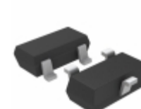
LT1460KCS3-5#TRPBF Linear Technology IC VREF SERIES 5V SOT23-3