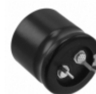
ECO-S2GP121CX Panasonic Electronic Components CAP ALUM 120UF 20% 400V SNAP