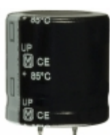
ECO-S2GP181DA Panasonic Electronic Components CAP ALUM 180UF 20% 400V SNAP