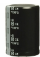
ECO-S2GB561EA Panasonic Electronic Components CAP ALUM 560UF 20% 400V SNAP