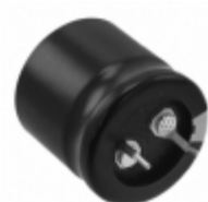
ECO-S2GP101CA Panasonic Electronic Components CAP ALUM 100UF 20% 400V SNAP