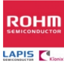
BA8201 ROHM BA8201 ROHM