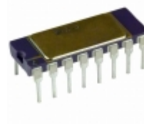
AD624CDZ Analog Devices Inc. IC OPAMP INSTR 25MHZ 16CDIP