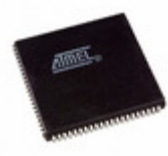
ATF1508ASVL-20JU84 Microchip Technology IC CPLD 128MC 20NS 84PLCC