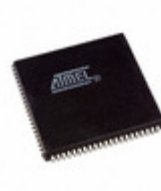
ATF1508ASVL-20JC84 Microchip Technology IC CPLD 128MC 20NS 84PLCC