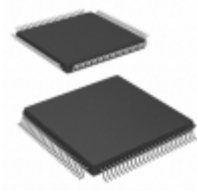
ATF1508ASVL-20AC100 Microchip Technology IC CPLD 128MC 20NS 100TQFP