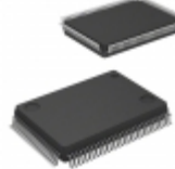
ATF1508ASVL-20QC100 Microchip Technology IC CPLD 128MC 20NS 100QFP