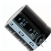
ECO-S2WB331EA Panasonic Electronic Components CAP ALUM 330UF 20% 450V SNAP