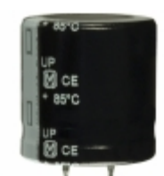
ECO-S2WP151DA Panasonic Electronic Components CAP ALUM 150UF 20% 450V SNAP