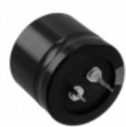
ECO-S2WP121DA Panasonic Electronic Components CAP ALUM 120UF 20% 450V SNAP