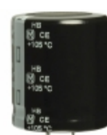
ECO-S2WB391EA Panasonic Electronic Components CAP ALUM 390UF 20% 450V SNAP