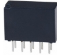
TN2-L2-H-4.5V Panasonic Electric Works RELAY GEN PURPOSE DPDT 1A 4.5V