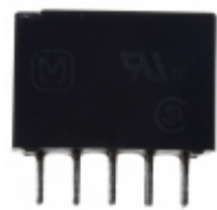
TN2-L2-H-12V Panasonic Electric Works RELAY GEN PURPOSE DPDT 1A 12V