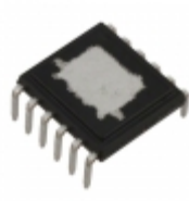
LNK458VG Power Integrations IC LED DRIVER OFFL DIM 1A EDIP12