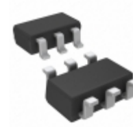
LT3467AES6#TRMPBF Linear Technology IC REG MULT CONFIG ADJ TSOT23