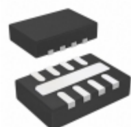
LT3467AIDDB#TRMPBF Linear Technology IC REG MULT CONFIG ADJ 1.1A 8DFN