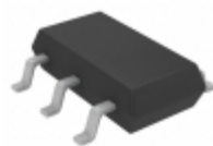
LT3467AES6#TRMPBF ADI (Analog Devices, Inc.) IC REG MULT CONFIG ADJ TSOT23