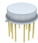
AD841KH Analog Devices Inc. IC OPAMP GP 40MHZ TO8-12