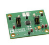
AD8418R-EVALZ ADI (Analog Devices, Inc.) EVAL BOARD FOR AD8418