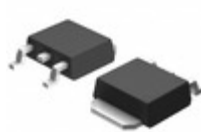
BD450M5FP-CE2 LAPIS Semiconductor IC REG LINEAR 5V 500MA TO252-3