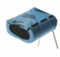
PM-5R0H155-R Eaton CAP 1.5F -20% +80% 5V T/H