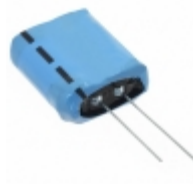
PM-5R0V155-R Eaton CAP 1.5F -20% +80% 5V T/H