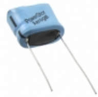
PM-5R0H474-R Eaton CAP 470MF -20% +80% 5V T/H