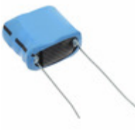
PM-5R0V474-R Eaton CAP 470MF -20% +80% 5V T/H