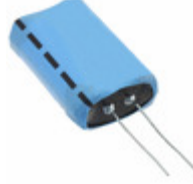
PM-5R0H305-R Eaton CAP 3F -20% +80% 5V T/H