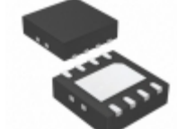
LT1964IDD#TRPBF Linear Technology IC REG LDO NEG ADJ 0.2A 8DFN