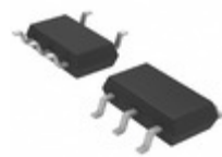
LT1964IS5-BYP#TRMPBF Linear Technology IC REG LDO NEG ADJ 0.2A TSOT23-5