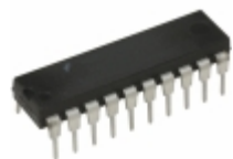
DM74AS1805N Fairchild/ON Semiconductor IC GATE NOR 6CH 2-INP 20-DIP