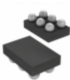
MAX6071ANT25+T Maxim Integrated IC VREF SERIES 2.5V 6WLP