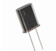
MP245-E CTS-Frequency Controls CRYSTAL 24.5760MHZ SERIES T/H