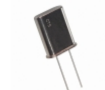
MP245 CTS-Frequency Controls CRYSTAL 24.5760MHZ SERIES T/H