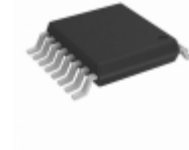
74VHC595MTC AMI Semiconductor / ON Semiconductor IC SHIFT REGISTER 8BIT 16TSSOP