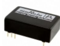
NCS12S4805C Murata Power Solutions Inc. DC/DC CONVERTER 5V 12W