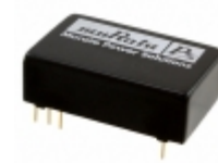
NCS12S4803C Murata Power Solutions Inc. DC/DC CONVERTER 3.3V 12W