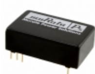
NCS12S1215C Murata Power Solutions Inc. DC/DC CONVERTER 15V 12W