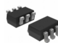
NCS199A2RSQT2G AMI Semiconductor / ON Semiconductor CURRENT SENSE AMP G=100