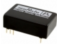
NCS12S4812C Murata Power Solutions Inc. DC/DC CONVERTER 12V 12W