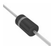
ICTE-018G ON Semiconductor TVS DIODE 18VWM 30VC AXIAL