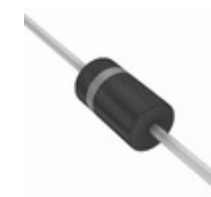
ICTE-15RL4 ON Semiconductor TVS DIODE 15VWM 25VC AXIAL