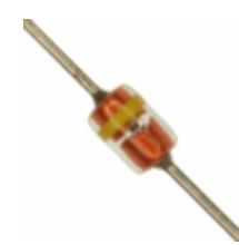
MTZJT-772.7B Rohm Semiconductor DIODE ZENER 2.7V 500MW DO34