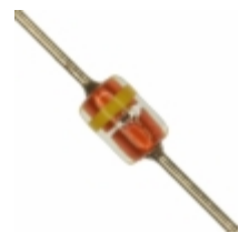
MTZJT-7727B Rohm Semiconductor DIODE ZENER 27V 500MW MSD