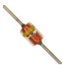
MTZJT-7720C Rohm Semiconductor DIODE ZENER 20V 500MW MSD