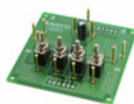
LV8400VEVB AMI Semiconductor / ON Semiconductor BOARD EVAL FOR LV8400V