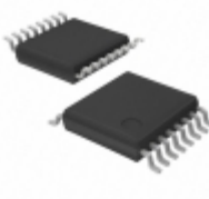
LV8401V-MPB-E ON Semiconductor IC BRIDGE DRIVER PAR SSOP-16