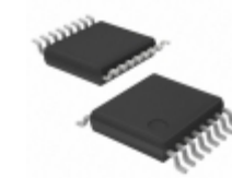
LV8400V-TLM-E ON Semiconductor IC MOTOR DRIVER PAR 16SSOP