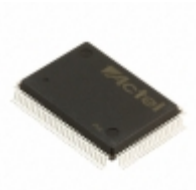
A40MX02-1PQ100I Microsemi Corporation IC FPGA 57 I/O 100QFP