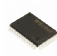
A40MX02-1PQ100M Microsemi Corporation IC FPGA 57 I/O 100QFP