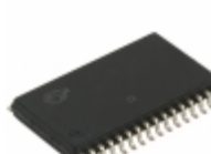
CY62128ELL-45SXIT Cypress Semiconductor Corp IC SRAM 1MBIT 45NS 32SOIC