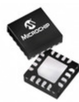
PIC16F18324-E/JQ Microchip Technology IC MCU 8BIT 7KB FLASH 16UQFN