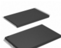
AT29LV1024-15TC Microchip Technology IC FLASH 1MBIT 150NS 48TSOP