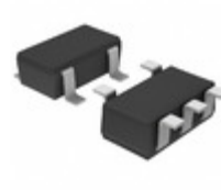
BU7421G-TR Rohm Semiconductor IC OPAMP GP 90KHZ 5SSOP