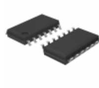
BU7444F-E2 Rohm Semiconductor IC OPAMP GROUND SENSE 8SOIC