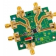
AD8349-EVALZ Analog Devices Inc. IC QUADRATUR MOD 700MHZ EVAL BRD