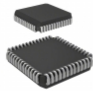
AT89C51CC03C-S3SIM Microchip Technology IC MCU 8BIT 64KB FLASH 52PLCC