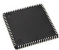
XC95108-20PC84I Xilinx Inc. IC CPLD 108MC 20NS 84PLCC