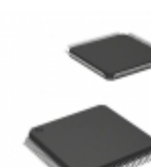
XC95108-15TQG100C Xilinx Inc. IC CPLD 108MC 15NS 100TQFP