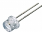
DPGEW1S09H Excelitas Technologies LASER DIODE 905NM PULSE SEMI TO