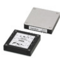
DPG750 Cosel AC/DC CONVERTER