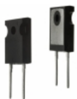
DPG60I400HA IXYS DIODE GEN PURP 400V 60A TO247