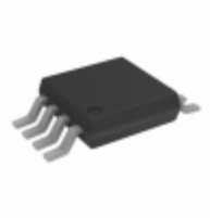
ADG801BRM Analog Devices Inc. IC SWITCH SPST 8MSOP