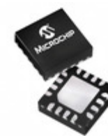
PIC16F15324T-I/JQ Microchip Technology IC MCU 8BIT 7KB FLASH 16UQFN