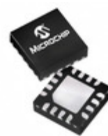
PIC16F15324-E/JQ Microchip Technology IC MCU 8BIT 7KB FLASH 16UQFN