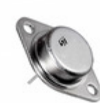
LM323K STMicroelectronics IC REG LDO 5V 3A TO3