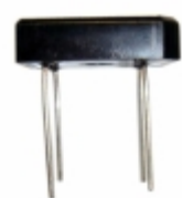
PB66 Micro Commercial Co RECTIFIER BRIDGE 6A 600V PB-6