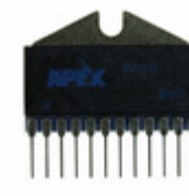
PB63DPA Apex Microtechnology IC OPAMP POWER 1.2MHZ 12PWSIP