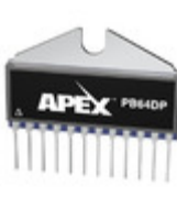
PB64DP Apex Microtechnology IC AMP DUAL PWR 600KHZ DP