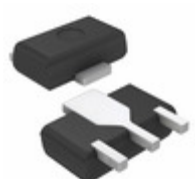
AN8009M Panasonic Electronic Components IC REG LDO 9V 50MA 3HSIP