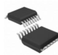
AN8011S-E1V Panasonic Electronic Components IC REG CTRLR BUCK/BOOST 16SO