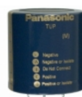
ECE-P1KP183HA Panasonic Electronic Components CAP ALUM 18000UF 20% 80V SNAP