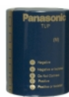
ECE-P1KP223HA Panasonic Electronic Components CAP ALUM 22000UF 20% 80V SNAP