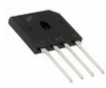
GBU6K AMI Semiconductor / ON Semiconductor RECT BRIDGE GPP 6A 800V GBU