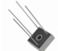
KBPC3508W GeneSIC Semiconductor DIODE BRIDGE 800V 35A KBPC-W