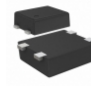
S-80123BNPF-JGITFU SII Semiconductor Corporation IC VOLT DETECTOR 2.3V SNT-4A