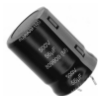
ECO-S2HP560BA Panasonic Electronic Components CAP ALUM 56UF 20% 500V SNAP