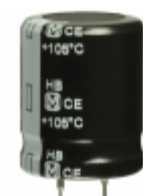
ECO-S2WB101CA Panasonic Electronic Components CAP ALUM 100UF 20% 450V SNAP