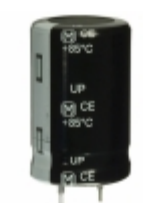
ECO-S2HP680BA Panasonic Electronic Components CAP ALUM 68UF 20% 500V SNAP