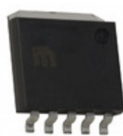
MIC37301-1.5BR Microchip Technology IC REG LDO 1.5V 3A SPAK-5