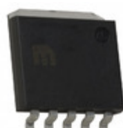
MIC37301-1.5WR Microchip Technology IC REG LDO 1.5V 3A SPAK-5