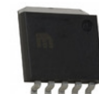
MIC37301-1.5BR TR Microchip Technology IC REG LDO 1.5V 3A SPAK-5