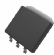
MIC37300-3.3WR Microchip Technology IC REG LDO 3.3V 3A SPAK-3