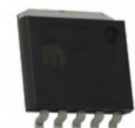
MIC37301-1.8BR Microchip Technology IC REG LDO 1.8V 3A SPAK-5