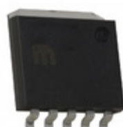
MIC37301-1.65BR Microchip Technology IC REG LDO 1.65V 3A SPAK-5