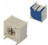
3361S-1-501GLF Bourns, Inc. TRIMMER 500 OHM 0.5W GW SIDE ADJ