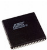
ATF1508ASVL-20JU84 Microchip Technology IC CPLD 128MC 20NS 84PLCC