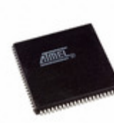
ATF1508ASVL-20JC84 Microchip Technology IC CPLD 128MC 20NS 84PLCC