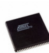
ATF1508ASV-15JU84 Microchip Technology IC CPLD 128MC 15NS 84PLCC