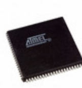
ATF1508ASVL-20JI84 Microchip Technology IC CPLD 128MC 20NS 84PLCC