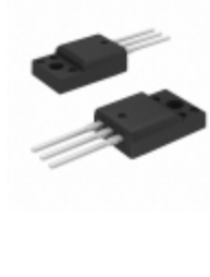
FCPF20N60T AMI Semiconductor / ON Semiconductor MOSFET N-CH 600V 20A TO-220F