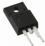
FCPF20N60TYDTU Fairchild/ON Semiconductor MOSFET N-CH 600V 20A TO-220F