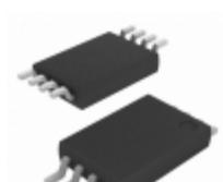
AT25128B-XHL-T Microchip Technology IC EEPROM 128KBIT 20MHZ 8TSSOP