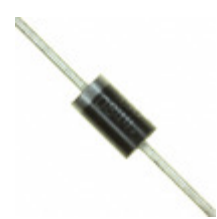
MR854RLG ON Semiconductor DIODE GEN PURP 400V 3A DO201AD