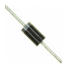
MR856G ON Semiconductor DIODE GEN PURP 600V 3A DO201AD