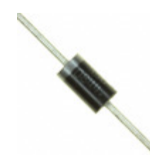
MR856 ON Semiconductor DIODE GEN PURP 600V 3A DO201AD