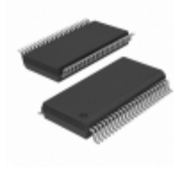
CY8C3865PVA-051 Cypress Semiconductor Corp IC MCU 8BIT 32KB FLASH 48SSOP