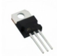
STPS30L60CTN STMicroelectronics DIODE ARRAY SCHOTTKY 60V TO220AB