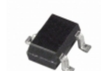
ADM1813-10AKS-RL7 Analog Devices Inc. IC MONITOR RESET 4.35V SC70-3