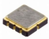
LT1236BILS8-5#PBF ADI (Analog Devices, Inc.) IC VREF SERIES 5V 8CLCC